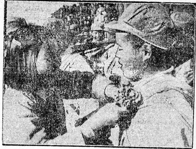
Jelenet „A kínai nép győzelme” című filmből

Ez a művészi filmalkotás új erőt ad küzdeleminkhez. Megtekintése