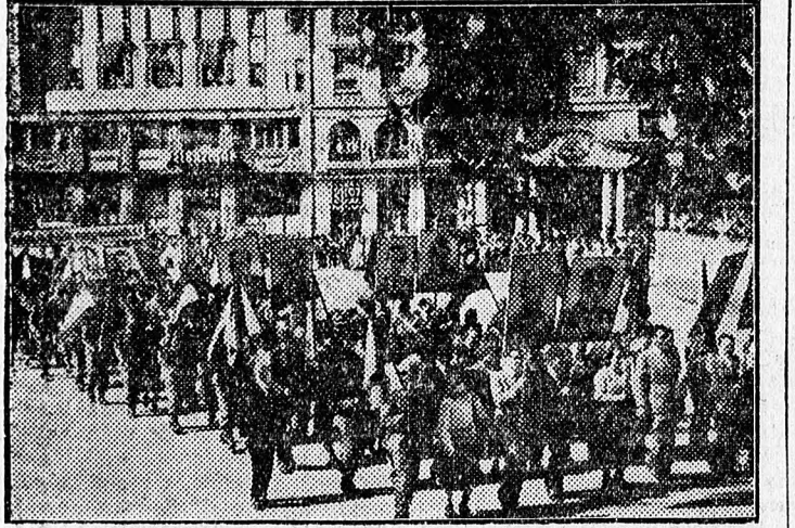
A május 1 tiszteletére indított versenyben győztes bútorgyári dol- gozók egyik csoportja

Néhány másodperc szünet, hogy aztán az elvonulók helyébe újabb százak és ezrek jöhessenek. Szé-