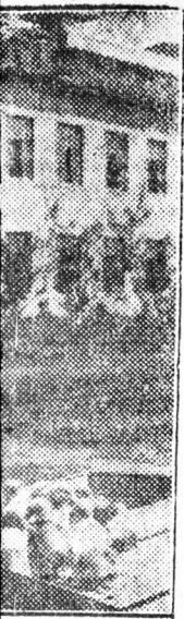
omfitelepen állatáló n-díjjal kitüntetett pos kacsákat.