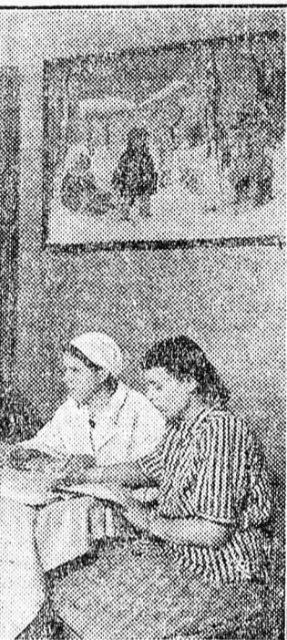
A Szovjetunióban gyermektanácsadó intézetek kiterjedt hálózata szolgálja a gyermekek egészségvédelmét. Képeinken a moszkvai Moszkvovoreckij-terület tanácsadó intézményében az édesanyák és az intézet orvosnőjének megbeszélését láthatjuk.