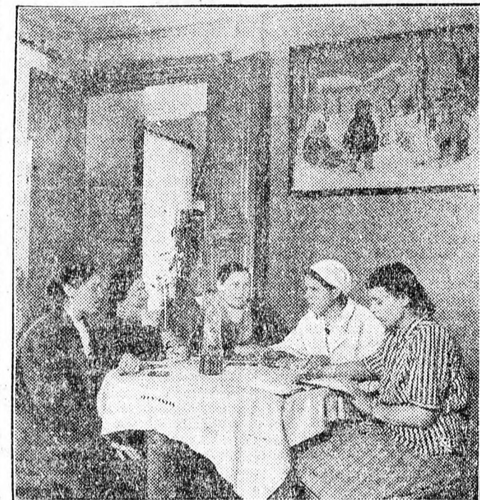
A Szovjetunióban gyermektanácsadó intézetek kiterjedt hálózata szolgálja a gyermekek egészségvédelmét. Képeinken a moszkvai Moszkvovoreckij-terület tanácsadó intézményében az édesanyák és az intézet orvosnőjének megbeszélését láthatjuk.