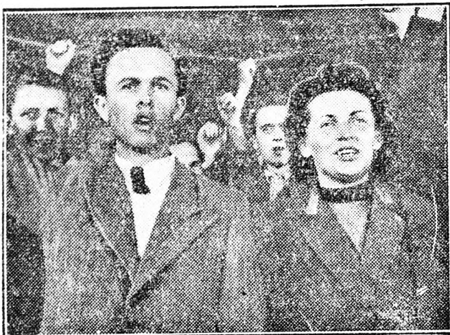
Jelenet a „Demokratikus Németország“ című filmből.

A Béke filmszínház szombaton mutatta be a „Demokratikus Németország“ című Sztálin-díjjal kitüntetett nagy, színes dokumentumfilmet. A filmben néhány pilanatra megelégedett e öltünk a burzsoázia igájában görnyedő német munkásokkal, a junkerek birtokán nyomorgó német paraszti élete. Láttuk hogy a fasizmus, a rablóháború milyen pusztítást vitt véghez Németországban. De azt is láttuk, hogyan maradtak épen a porig bombázott városokban is az amerikai édekeltésű vegyi és egyéb ipari üzemek. Láttuk a nyugati zónában a munkanélküliek tömegeit, de láttuk azt az éjszánt harcot is, amit a nyugatnémet munkássztrájk a Kommunista Párt vezetésével folytat Németország egységéért, hogyan küzd a német milírizmus felélesztése ellen. Láttuk a kivétező utat a pusztulásból, a