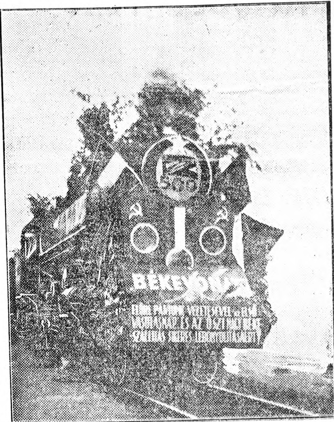
Ez a „békevonat” vitte a vasutas dolgozók felajánlásait a Vasutas Napra.