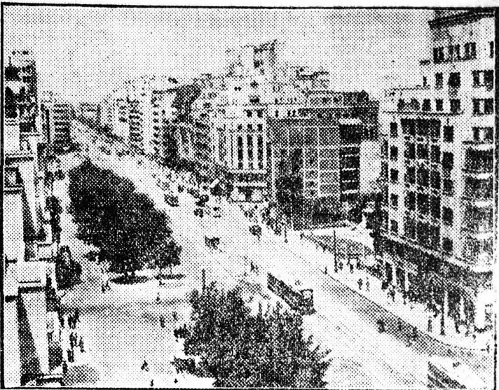
A bukaresti Magheru út egyik részlete.