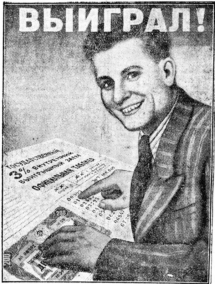
Szovjet plakát a tervkölesön nyerevénykötvényeknek sorsolása alkalmával