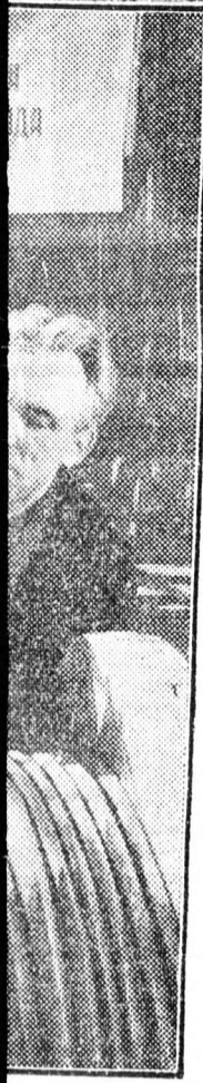
erőműépítkezések karított anyagból. A képen: A. Kal... az első kábel...