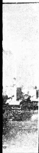
Páncélosok legendás hírű lett fényes szeptember assák: ren.