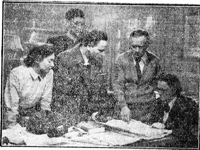
Jelenet „Gyarmat a föld alatt” című filmből.

A legjobb pályázók között 25 értékes díjat osztanak ki. Többek között néprádiót, márkás tőtőtollat, könyveket stb.