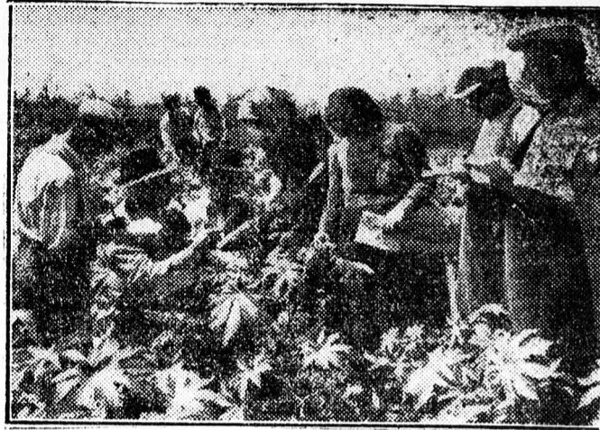
Képünk a Szovjetunióban a közelmúltban járt magyar paraszka- döltség egy csoportját ábrázolja, amint a Karl Marx egyesített kol- hozban a nagyüzemi gazdálkodás nagyszerű eredményeit tanulmá- nyozzák.