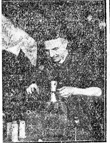
Weber László sztahanovista felküzsgeszteses lakatos az első közzött jegyzete másfészerezését ünnepel a Vagongyár. Kipirult, vidám arcok hajlanak a gépek fölé. Reggel — munka kezdete előtt — röpgyűléseket tartottak. Itt olvasták fel a minisztertanács felhívását és felszólították a dolgozókat, hogy jegyzésükkel segítsék öt éves tervünk megvalósítását, járuljanak hozzá a béke megvédéséhez. Dalok, versek, csaszluskák telték ünnepléssé a hangulatot. Már a felszólalásokból világossá vált hogy dolgozóink szívvel-lelkelkel készek a segítségre.

A hangszórók indulókat játszanak. Az üzemenzsek zöld galyakkal, zászlókkal, képekkel, piros drapériával vannak feldíszítve.