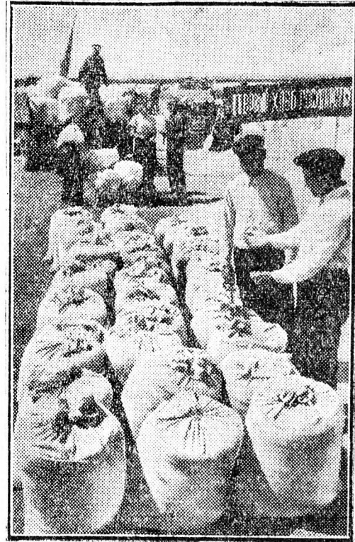
A szovjet kolhozparasztok első kötelességüknek tekintik, hogy a gabonabeadását teljesítsék. Képiünk a moldvai Dzerzsinszkij-kolhozban készült, ahol elszállításra készen áll a gondosan megtisztított gabona.