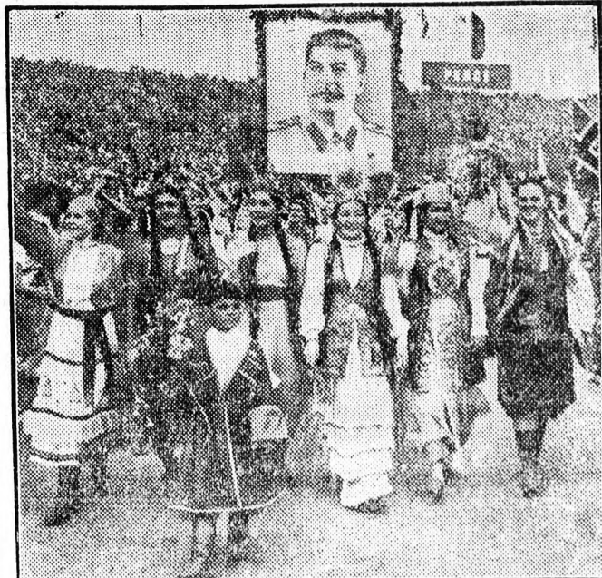
Komszomolisták felvonulása a nyári berlini Világifjúsági Találkozón.

Az állami gazdaságok versenyében a bődönháti továbbra is megtartja a versenydíjat. A vetés hat napja elvégezte, mélyszántásának 52 százalékát tart. A gazdaság dolgozói jó munkájukért 20.000 forint értékű iparcikkutalványt kaptak. A megyei gépjárműversenyben a legjobb munkát a derecskei végzett. Őszi talajmunka tervét 47,3 százalékra teljesítette: jutalmul kapja az MB vándorzászlaját.