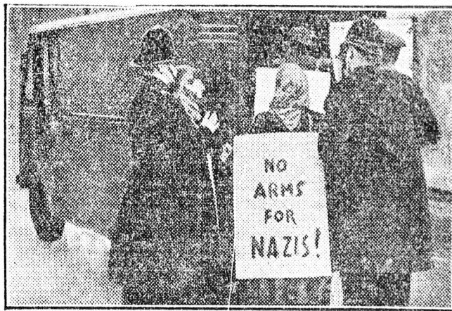
Angol békeharcosok tüntető felvonulást rendeztek London utcáin és hatalmas táblákon követelték, hogy ne fegyverezék fel a náciakat. A brutálisan fellépő rendőrség a tüntetők közül többet rabszállító autókra állított elő.