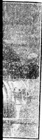
...rdulója tisz... ...dolgozóit, ...nov beállító ...akik min...