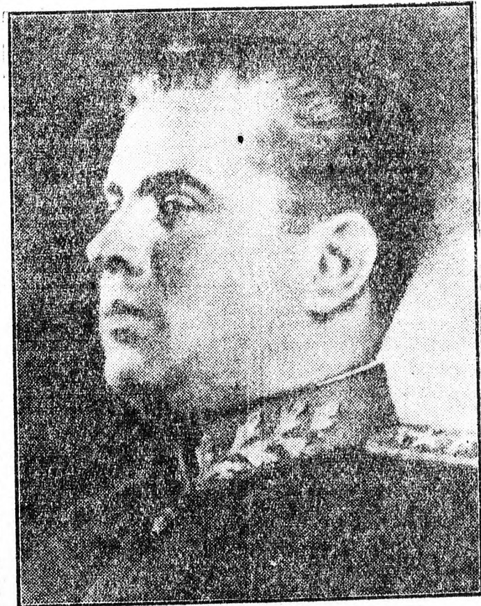
Enver Hodzsa elvtárs, az Albán Népköztársaság miniszterelnöke

A Gépiparmentáló, Cementipari Vállalat és több más debreceni és hajdú-biharmegyei üzem eddig meg nem tett felajánlást a tervteljesítésre és nem jelentették, hogy Szálán elvtárs születésnapjának tiszteletére évi ter-üket mikorra fejezzék le.