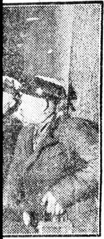
Sz. Makarov Szék... pünkön Sz. Makapaszatatait hall...