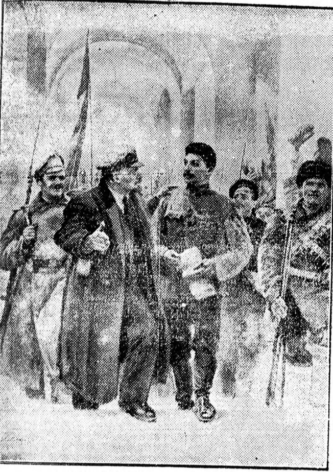
LENIN MEGÉRKEZIK A SZMOLNIJ PALOTABA

Az emberek azt mondták neki: — Keresd a Szmolnijban! Sokáig ment az öreg, keresztül az egész városra, míg végre odaért egy óriási épülethez. — Az épület előtt maglyák égetek és géppuskák álltak. A géppuskák mellett matrózok és katonák jártak föl s alá. — Ez volt a Szmolnij. Meglepett az öregnek egy fiatal matróz. Egyre topogott a közegeten a csizmájával és egymásra ültögette a két karját: melegepedt. Mert nagyon hideg volt, csipős szél fúj a tenger felől. — Odaszólt neki az öreg: — Lenint szeretném látni! — A matróz tetőtől-talpig végigmérte és megkérdezte: — Aztán minék akarsz te, öreg, Leninnel beszélni? — Aztért jöttem, hogy elmondjam neki, hogy élünk mi, parasztek. — Eridj, öreg, a parancsnokhoz engedélyt — mondta a matróz és megmutatta a parasztnak, hova kell mennie. — A lépcsőn libasorban álltak az emberek, akik a parancsnokkal elváltak beszélni. Piszkosak és csúszósak voltak a széles lépcsők, — látni lehetett, hogy sok nép jár ott az egész nap folyamán. — A parancsnok lassan írta meg az engedélyt: a puskához hozzá szokott a keze, de a tollal, azt nagyon bizonytalanul tartotta,