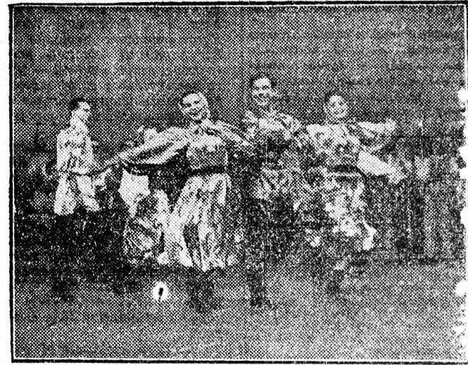
A Magyar-Szovjet Barátság Hónapját megnyitó operaházi díszelő... adáson fellépet az Urali Álami Népi Együttes, mely már első sze... replésével döntő sikert aratott. Képünk a „He-es urali quadrill” című táncot mutatja be