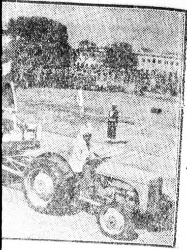
...telme az imperialista elnyomók... ...egy a talaj a gyarmatosítók lába...

...angolszások háborús politikájá... ...traktorok fel a Szovjetunió vezető... ...az Indiai Kommunista Párt ha... ...llyi békeníméletét ábrázolja.