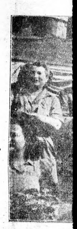
Az Arany Bika előtt