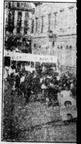
A ruhagyáriak együtt

A nyolcadik szabad sejtét vidám, boldog en- nepelték szerte az országban. Debrecenben már kor- dalm nótázó tette ha- utcákat. Lobogtak a város és nemzetiszíntű fiatalok és öregek