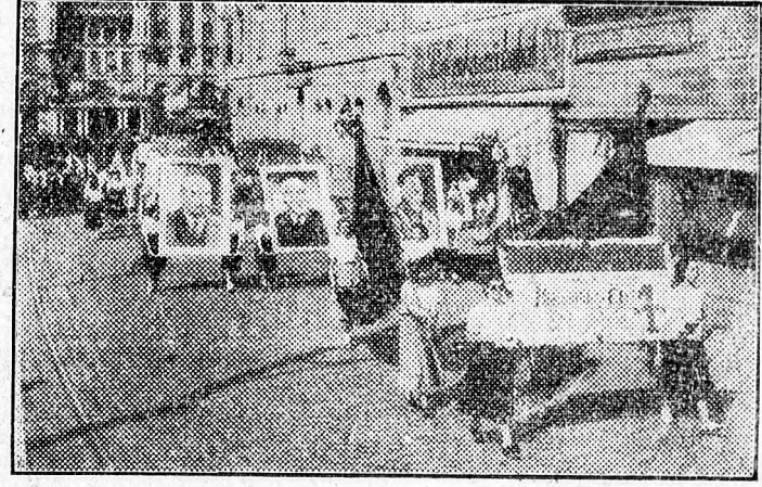
A harisnyagyári dolgozók Lenjin, Sztálin, Rákosi elvtársak fényképe alatt vonultak ki a nagyterdre.

A harisnyagyáriak nagy bástyát készítettek, az oldalait azok a szép eredmények díszítették,