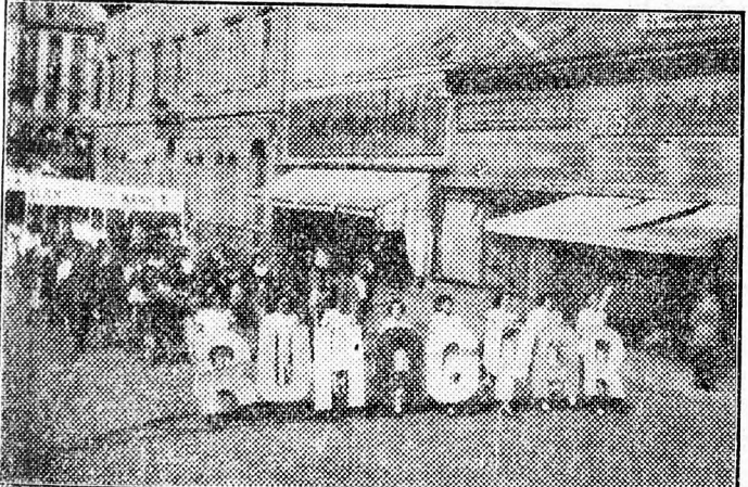
A ruhagyáriak együtt meneteltek kéz a kézben Néphadseregünk harcosáival.