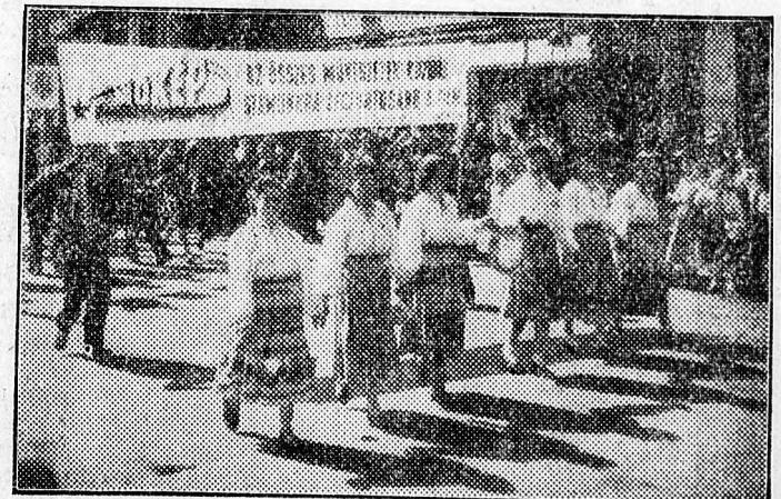
Szín pompás képet nyújtott a MOKEP felvonulása.