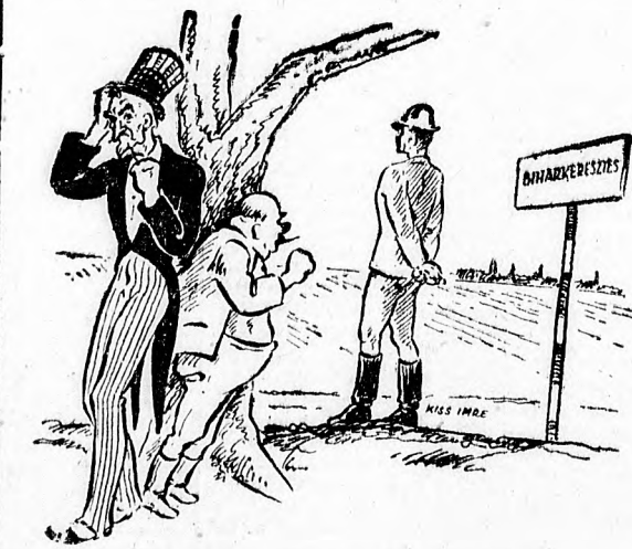
Uncle Sam. Itt felsültünk...