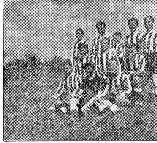
Régen libalegőkön futbaloztak a falusi fiatalok, most jól felszerelt, jólalajú pályák állnak a sportolni vágyó ifjak rendelkezésére. Képlünk az újtikosi labdarugócsapatot mutatja be, — új sportfészerelelőskben.