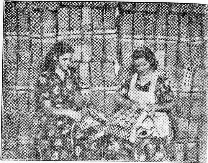
Virágzásnak indult a háziipar. A hajdúmánási szalmaiparok is a dolgozók örömeire termelnek. Képzőművészek két nánási asszony művészi szatyrokat készítenek.