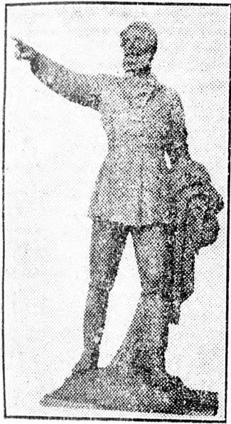
Kossuth Lajos születésének 150-ik évfordulójára Budapestben méltó emléket állít a magyar nép. Képünk: a szoborcsoportozat főalakját, Kossuth Lajost, a nagy szabadsághósti ábrázolja.

"Szent hagyományok földjén járunk" — mondotta Kossuth, amikor a Honvédelmi Bizottmánnyal Debrecenbe érkezett. Debrecen pedig éppen a forradalmi kormány