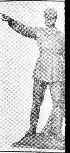
Kossuth Lajos születésének 150-ik évfordulójára Budapesti Nemzeti Művelődési Intézet által szervezett Kossuth Lajos Emlékverseny díjazottjai között a szegedi csoport vezetője, Kossuth Lajos, a nagy szabadságharc hőse ábrázolva.

„Szent hagyományok árunk” — mondotta Kossuth a Honvéde mi Bizottságban Debrecenben érkezett, Debrecenben éppen a forradalmi