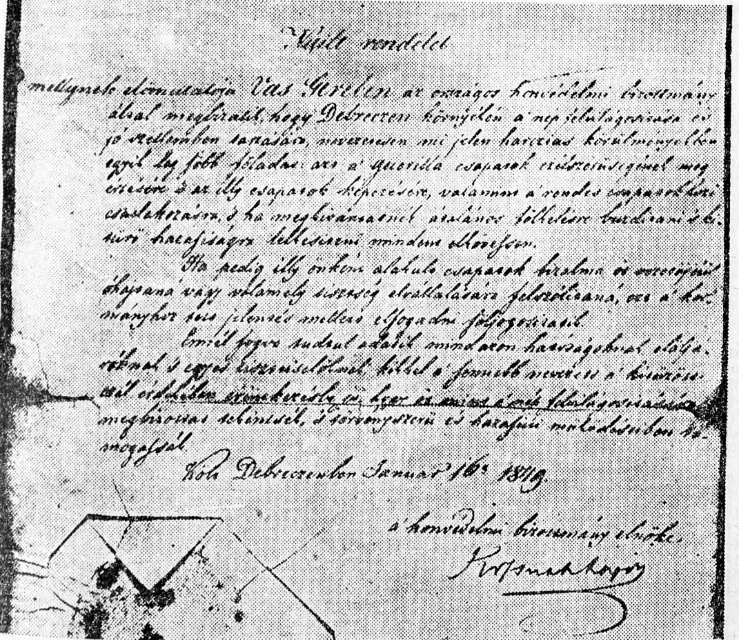
Kossuth Lajos saját kézzel írott „nyílt rendelete”, amellyel Vas Gerebent Debrecenbe küldte a hadsereg szervezésének egyik irányítójaként.