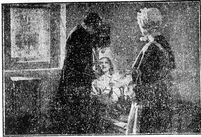
Jelenet a „Semmelweis“ című magyar filmből.