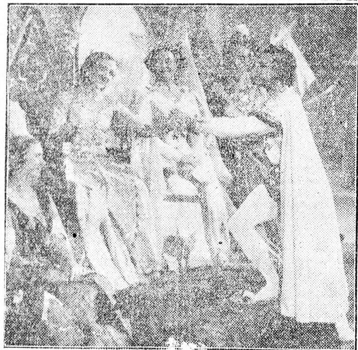
Jelenet a „Szárnyaló dallamok” c. filmből.

A Prémesszállattenyésztő Vállalat X. 15.161 XII. 31-ig előnyulbegyű-jtést tart. A belga óriás kivételével mindenfajta 2 kg-on felüli nyul-lat, először kg-ként 10 Ft-os áron, ugyanazt szerződésig 12 Ft-os áron átvész. A belga óriás ára kg-ként 3 Ft. szerződéssel 10 Ft. — Ajánlja fel átadó nyulait. Szállításiáról a vállalat gondoskodik. Na-gyonb tételt helyszínen készpenzfizetés ellenében vesz át. Kisebb tételt ellenértéket 48 órán belül kiegyenlíti. — PREMÉSÁLLATTE-NYÉSZTŐ VÁLLALAT: Buda pest. V. Sütő-utca 1.