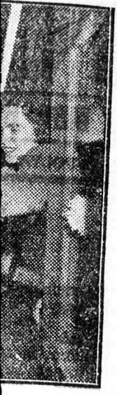
usán: „Most. arországig új rszágok képé. ban folyik a

Nagyistók József beszéde után az elnök berekesztette az ülést. Az országgyűlés szombati ülésének napirendjén az 1953. évi állami költségvetés vitájának folytatása, a költségvetési törvényjavaslat és az állami statisztikáról szóló törvényjavaslat tárgyalása szerepel.