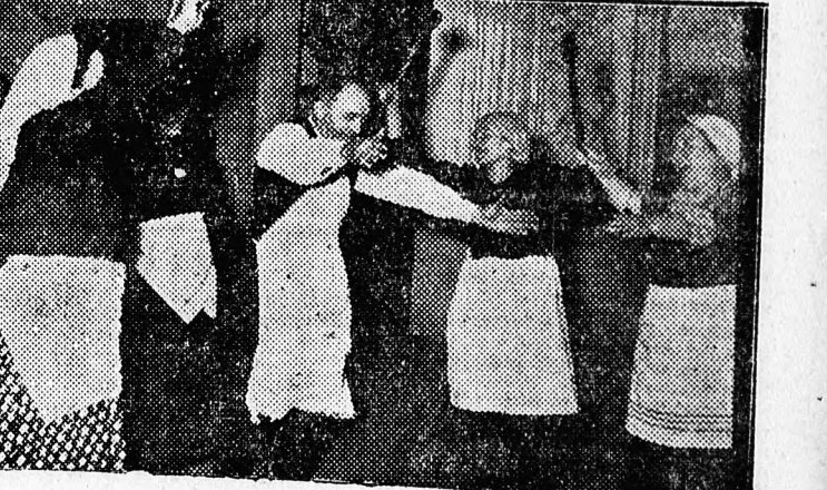
Jelenet a Földesi lakodalmából