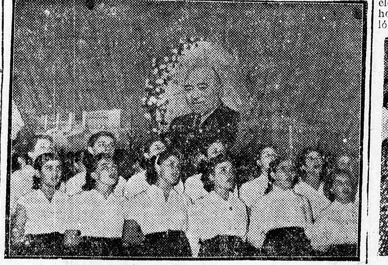
A hajdúböszörményi tanítóképző kórusa

A Magyar-Szovjet Barátsági Hónap keretében színházi ankét-tal rendez az MSZT és a Csokoi-nai Színház. Az ankét keretében Szász Lajos elvtárs tart elő-á-dást a szovjet színházról, a szovjet színház és a dolgozók kapcsolatáról. Az előadás után vita lesz, melyet Lendvai Pe-tenc elvtárs, a színház rendező-je vezet. Az ankét, amely méltán nagy érdeklődésre tarthat szá-mot, délután 6 órakor kezdődik a járási kultúrotthonban (volt Művészetek Háza). Vörös Hadsereg-útja 28. I. em.