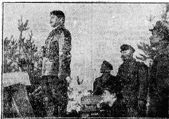
Jelenet a „Felldhetetlen 1919” című filmből

Bárdot és ellenséget arra figyelmeztet ez a film, hogy a felzárkózott nép ereje legyőzhetetlen.