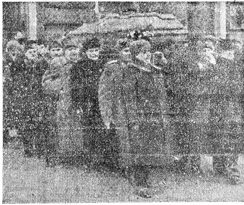
Sztálin elvtárs hűséges harcostársai kísérik utolsó útjára a nagy halottat. Elöl Malenkov, Molotov, Bulganyin, Kaganovics és Svernyik elvtársak. Jobbra Berija elvtárs.