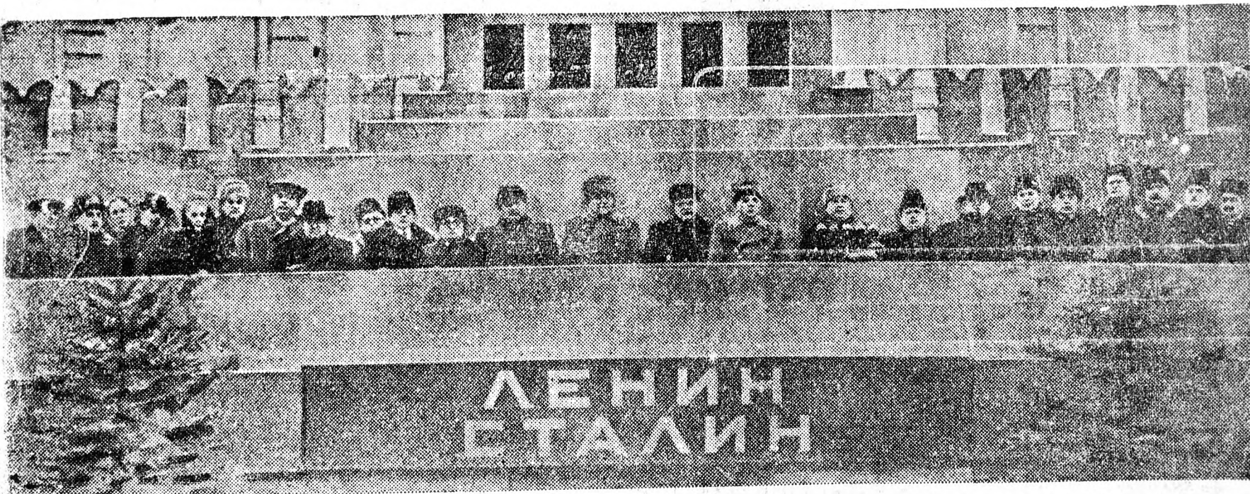
Sztálin elvtárs temetésén. A Lenin Sztálin-mauzóleum mellvédjén Malenkov elvtárs beszédet mond. A képen balról: Gheorghiu-Dej, Boleslaw Bierut, Pak Den Aj, Walter Ulbricht, Dolores Ibarruri, Otto Grotewohl, Viko Cservenkov, Rákosi Mátyás, Pietro Nenni, Palmiro Togliatti, Jacques Duclos, Klement Gottwald, N. A. Bulganyin, V. M. Molotov, K. J. Vorosilov, G. M. Malenkov, N. Sz. Hruscsov, L. P. Berija, M. Z. Szaburov, Csou En-Laj, M. G. Peruhin, L. M. Kaganovics, N. M. Svernyik és A. I. Mikojan elvtársak.