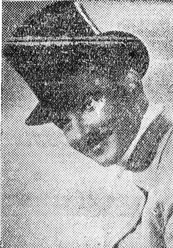
Itt a „papa fiát”, a galánis gentleman, a Brand-sörgyárak leendő örökösét és koronázatlan királyát látjuk. Végtelenül üresfejű... be-képzelt... de olesó bókjai és büvös milliói meghódítják az úri kis-asszonyok értelmes szívét. Hány ilyen here él — és sanyargatja a népet az úri Magyarországon. (Soós Inre.)