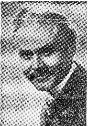
Ó, Katángy Menyhért legjobb ismeretfejele: a miniszterelnök úr barátja. Kapucán kibuktatja a képviselősegből, így veszélyben volt a zsiros vasútzagzatsággal járó elővesdem. Katángy a Körtvélyesi csíny kizsákmány. Kossuth eszméit bitorolva ül újra a nép nyakára. (Bicskey Károly.)