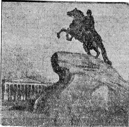
1703-ban alapította Nagy Péter cár Pétervárt. A lakosság Pitjergnek is nevezte városát, a mai Leningrádot. Nagy Péter lovasszobrára a Szandusz-téren áll. A felirat: I. Péternek, II. Katalin — 1783.

Palota Rastrelli építész alkotása, — most múzeum. Falait azok a híres festmények díszítik, termeit azok a szobrok töltik meg,