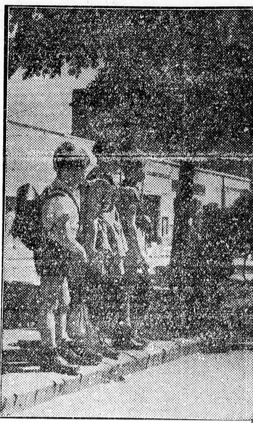
Az iskolákban a fegyelműzött magálatásra, a közlekedés egyes szabályainak betartására is megtanítják a gyerekeket. Képvonkón a három gyerek fegyelműzött megvárja, amíg Vörös Hadsereg útján szabad lesz az út és veszély nélkül átmenhetnek a töltső oldalra.