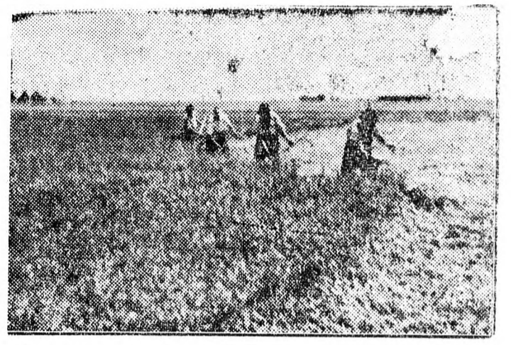
A macsi Néptanács termelőszövetkezeti csoportjában nem lesz gond az állatok átteleltetéséről, a szilárdtármány beadását követően.