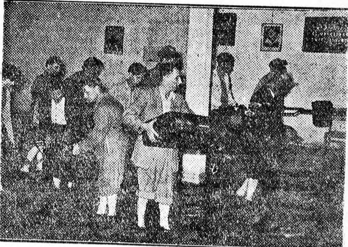
Képünk azt a jelenetet ábrázolja, amikor a Stúdió tagjai este 10 óra után a szennyvízből ki-mentik felszereléseiket, a szin-padi kellékeket, ruhákat és dísz-leteket, hogy autóra rakják, mert

Három évvel ezelőtt alakult a debreceni Sztaniszlavszkij Munkás Stúdió, amely a nagy szovjet rendező módszerei alapján országosan újranyírt mozgalmat indított el. Azóta az ország egyik legkiválóbb együttese lett, módszereit még külföldön is tanulmányozzák. A városi tanács „jövötábor” mégsem jutott három év óta megfelelő próbaterem a Stúdió számára. Felváltva 47 különböző helyen tartotta eddig próbáit. Legutóbb a Meteor-mozi alatti pincehelyiségbe költözött, melyet a MOKEP segítségével változtattott használhatóvá. A legutóbbi nagy események alkalmával azonban a szennyvíz elárasztotta a pincét.