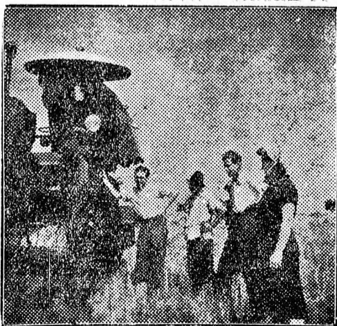
Kombajn aratja a hajdúszoboszlói Lenin tsz ősziárpáját.