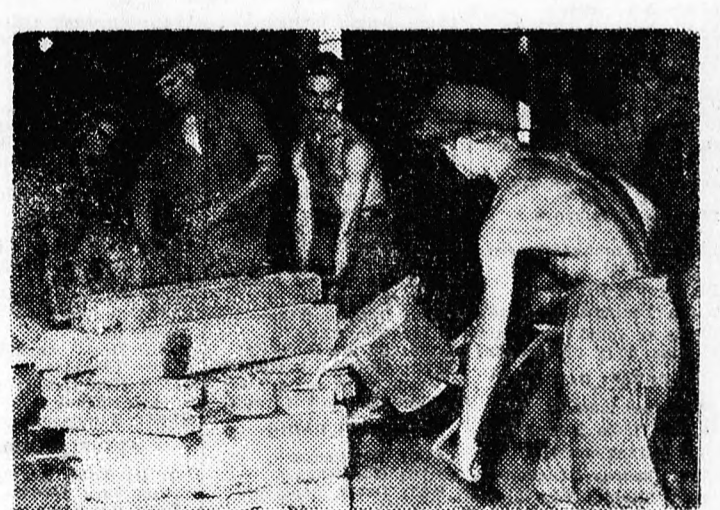
2. Az öntőbrigád tagjai a legnagyobb kokillát öntik. Pontos, fejelemzett munkájuk ezen a napon selejtmentes műszakot eredményezett.