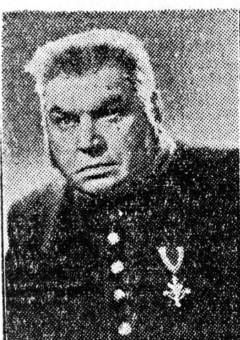
Ime, Szkozovik-Dmukanovszky Antonovits Anton, avagy Selmeczy Mihály. Ő a polgármester, a darabban szereplő orosz kisváros mindenható ura. Korrupció, megvesztegetés nála az élet természetes rendjét jelenti. Ilyen módszerekkel akar eredményre jutni, amikor

EBBŐL AZ ALKALOMBÓL BEMUTATJUK GOGOLY VILÁGHIRŰ SZATIRAJÁNAK EGY-KÉT NEVEZETES ALAKJÁT