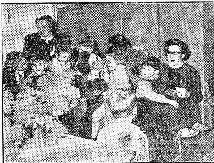
Albán nőküldöttek és a chitaj ügyvédnö látogatása a debreceni Ruhagyár napköziotthonában.