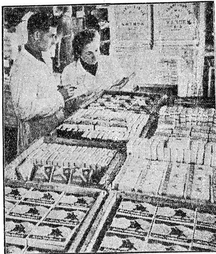
Cigaretta-csomagolás az egyik dohánygyárban.