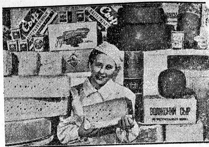
Bőséges árukészlet áll a fogyasztók rendelkezésére a csemegeüzletekben. A képen az egyik moszkvai csemegeüzlet részlete.