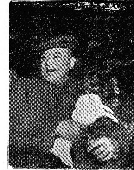
Borisz Andrejev többszörös Sztálin-díjas, az OSZSZSZK népművésze