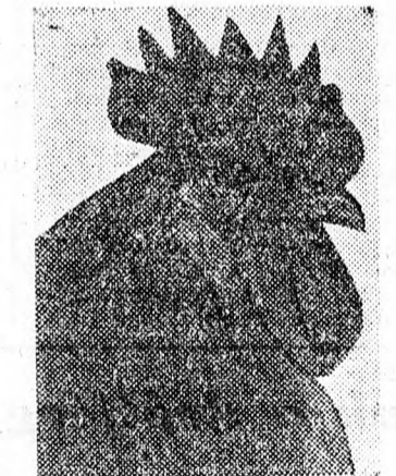
Nemesített sárga magyer kakas

A tél vége felé azonban más anyagok is hiányoznak a tyúkok szervezetéből. A kis csibének is szükséges a vitamin, amit a tojás sárgájából — élete első idejében — a székkel kap. Hogy a tenyésztőjásainkban elegendő vitamin legyen: etessünk nagy vitamintartalmú sárgarépát. Ajánlatos még lucernalisztet, murokrépat és kevés sörélesztőt is etetni és a vitaminok biztosítá-