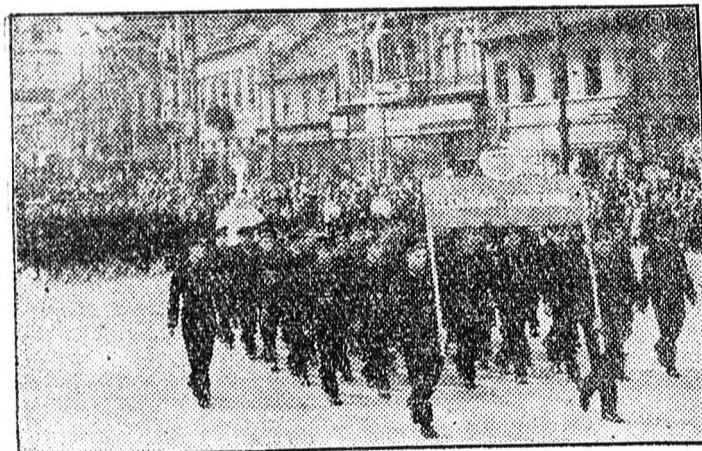
Az MTH fiatalokat az élenjáró tanulók vezetik