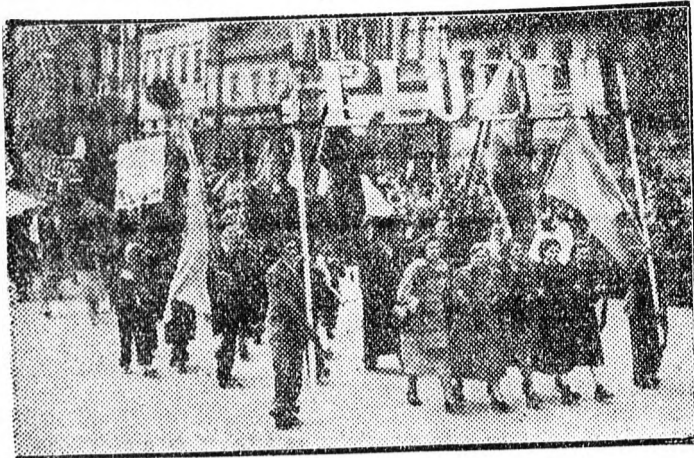
Eljűzem — hirdeti a Debreceni Erőmű fejrata