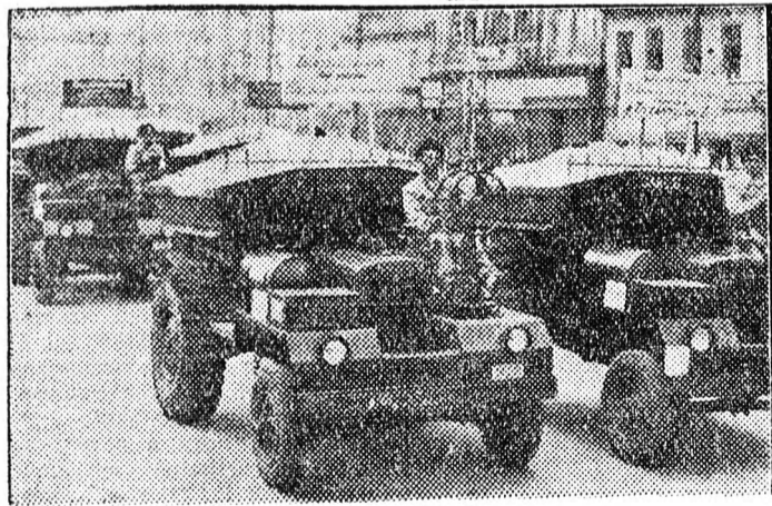
Démperek a Vörös Hadsereg-útján. Elöl a „Nyügös” és a „Jancsi”