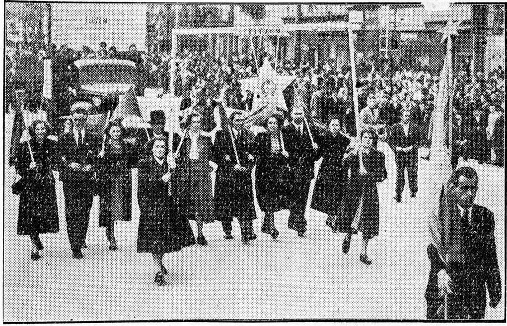
A büszke élüzem jelvény alatt vonulnak május elsején az Alföldi Nyomda dolgozói

Eljen a tizedik szabad május! — olvashatjuk az Erőmű dolgozóinak egyik tábláján. Az Erőmű dolgozói boldogan ünneplik ezt a napot. Kettős ünnep ez számukra: a proletármunkásoké, a munka ünnepe s ünnep azért is, mert ebből az alkalomból üzemük falára is élüzem jelvény került. Sok nehézséggel küzdve vívták ki a sikert az Erőmű dolgozói s munkájuk elismerése a büszke élüzem cím odaítélése. Az Orvostudományi Egyetem