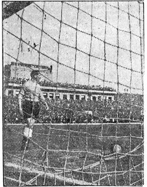
Az első magyar gól

bevált, jól megértették egymást. Kocsisnak aki szintén a legjobbak közé emelkedett ezen a mérkőzésen is.