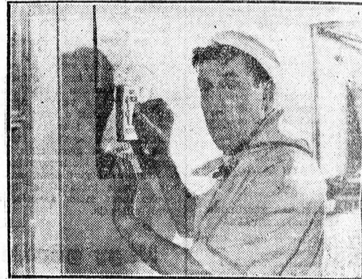
Jelenet az „Apa lett a fiam” című francia filmből