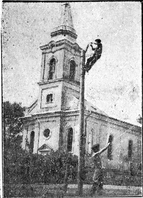
Körösszakál községben rövidesen kigyúl a villanyfény. A Titusz dolgozói már szerelik a légvészleket