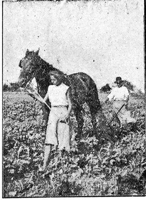
A berettyóújfalui Dózsa tsz-ben nagy lendülettel kezdtek a munkákat. Minden erőt a növényápolásra mozgósították.