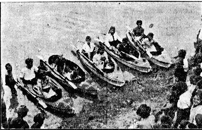
Csónakverseny a holt Tiszán

A gyönyörű parkban labdarúgó pálya, röplabda pálya, hinta és számos egyéb szórakozási lehetőség van. A gyermekotthon zenekara nem régen alakult, most készülnek az évzáró ünnepélyre, ami a 16 tagú zenekar bemutatkozó hangversenye lesz. Tangó-harmónika, zongora, esellő, furulya, hegedű, xilofon, dob a zenekar felszerelése.