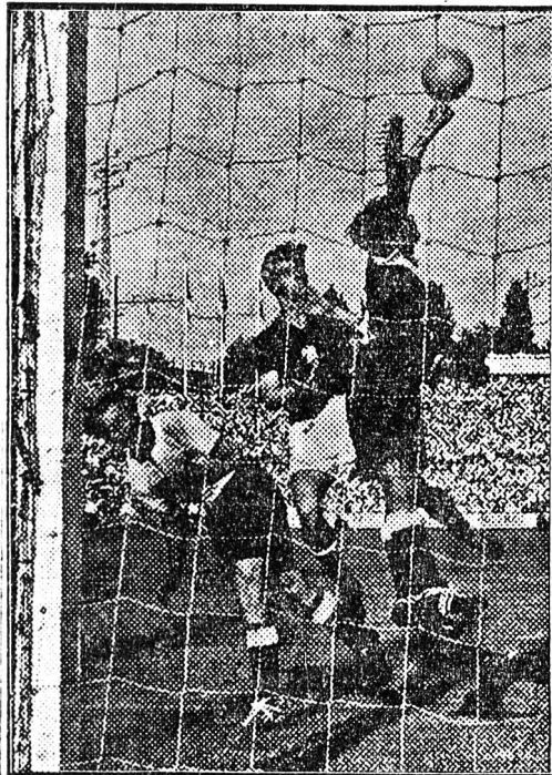
A labdarúgó VB legdurvább játékos, a nyugat-német Liebrich. A kép baloldalon látható. Talán éppen most tervelt ki, amikor a nyugat-németek kapus csak bravurral mentti Kocsis fejesét — hogy a legközelebbi percekben lerugja Puskás Ferencet.

A brazilok elleni mérkőzésre készülő magyar labdarúgó válogatott keret tagjai közül pénteken délelőtt csak Lóránt és Gulyás tartott könnyebb edzést. Lóránt a próbarúgások után kijelentette, hogy vállalja vasárnap a játékot. A csapat tagjai péntek délután kisebb kirándulást tettek, majd szombat délelőtt még egy rövid edzést tartanak. A játékosok körében uralkodó hangulat igen jó, bizakodással várják a világszerte nagy érdeklődéssel kísért vasárnapi mérkőzést. A magyar csapat vezetői csak vasárnap délelőtt jelölik ki a Brazília elleni pályára lépő 11-et. Puskás játékára valószínűleg nem lehet számítani.