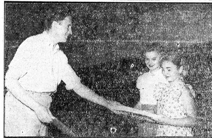
Kiosztják a jutalomkönyveket

Az üzemi újságok fontos feladatot töltenek be az üzemek, gyárak, vállalatok életében. Azaz, hogy állandóan napirenden tartják a soronlevő feladatokat, azok végrehajtására mozgósítanak, bátran feltárják a hibákat és megmutatják azok kijavításának módját, a termelés egyik fontos lendítőjévé válnak. Ugyanakkor a bírálat és önbírálat helyes alkalmazásával nevelik a dolgozókat és vezetőket egyaránt.