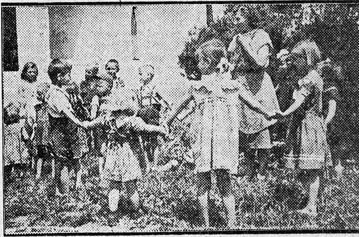
A Rákosi-telepi Dózsa tsz napközi otthonában gondos felügyelet alatt játszadoznak a gyermekek, miközben szülei kivehetik részüket a növényápolás munkájából

Búzájuk 14 mázsa termésígér, ennek betakarítására gondosan felkészült a szövetkezet.